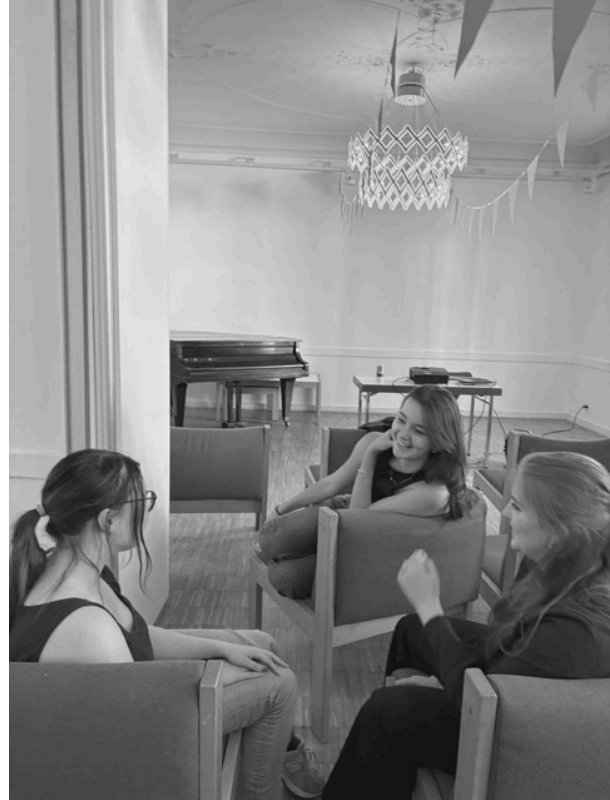
Eindrücke aus vereinsinternen KYRI-Veranstaltungen.

Der KYRI-Geburtstag wurde im Anschluss an die Mitgliederversammlung nachträglich gefeiert. In guter Stimmung, begleitet von festlicher Musik und einem selbst aufgebauten Buffet, wurde KYRIs vierter Geburtstag im Saal der KHG gemeinsam zelebriert, und der Abend klang mit Gesprächen über anstehende Pläne und Hoffnungen für das „neue“ Geschäftsjahr aus.